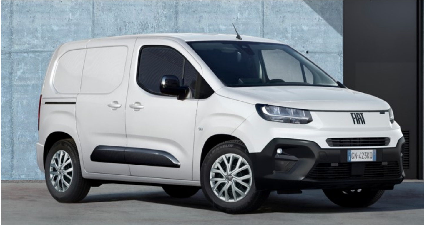
Габаритні розміри, мм

Забарвлення кузова пастельною фарбою білого кольору (код 549 - ICY WHITE)